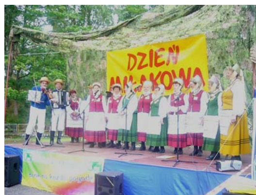
Występ Warmianek podczas Dnia Miłakowa