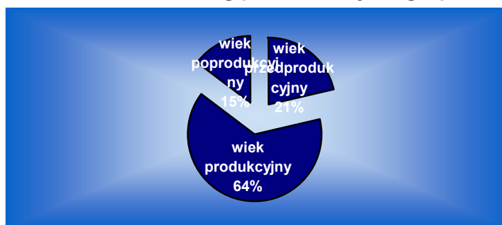
Wykres nr 1. Struktura wieku wg podstawowych grup funkcjonalnych