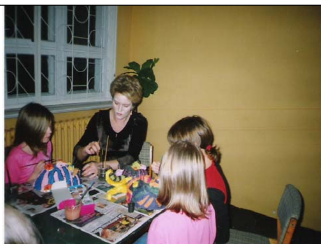
Zajęcia z rękodzieła