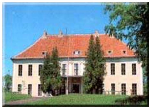
Zabytkowa kuźnia i pałac w Ponarach.