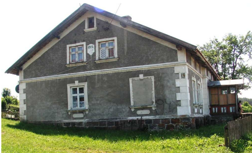
Stare Bolity; dom z 1912 r.

We wsi dominuje zwarta zabudowa jednorodzinna i zagrodowa . Posesje są w większości zadbane i utrzymane w czystości. Przy domach są ogródki. Domy zachowały charakterystyczną dla Prus architekturę, w większości pochodzą z początku XX w. W ostatnich latach powstały tu tylko dwa nowe domy.