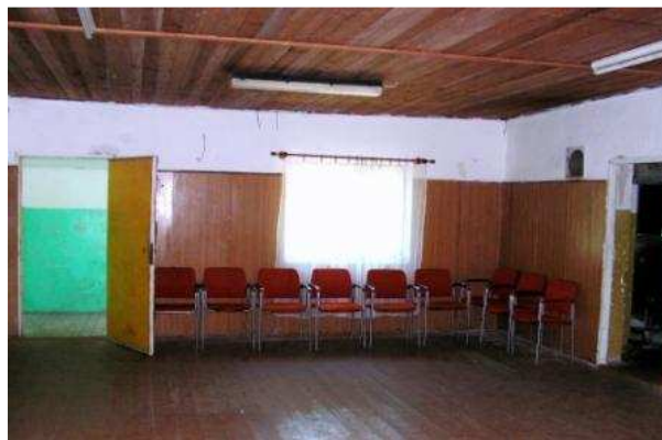
Wnętrze świetlicy w Starych Bolitach