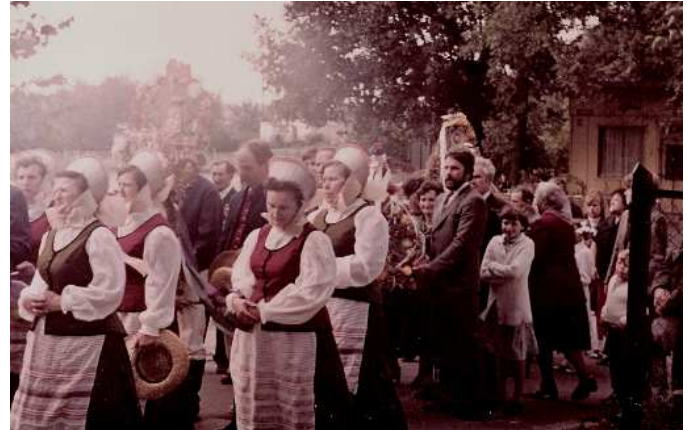
Członkinie KGW ze Starych Bolit podczas Dożynek Gminnych, lata '80'

Spółeczność lokalna zintegrowana była wokół istniejącej do 2002 r. szkoły. Przez wiele lat w szkole w Starych Bolitach działał szkolny klub sportowy , klub PCK , była drużyna harcerska , działał teatrzyk szkolny .