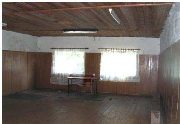
Wnętrze świetlicy w Starych Bolitach