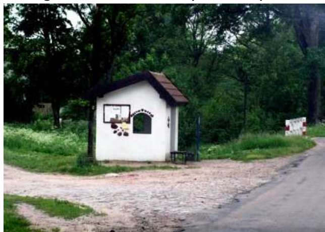
Przystanek PKS w Starych Bolitach

W miejscowości funkcjonuje komunikacja PKS, oraz linie prywatne . Stare Bolity mają połączenie z Braniewem, Ornetą, Pieniężnem, Miłakowem i Morągiem.