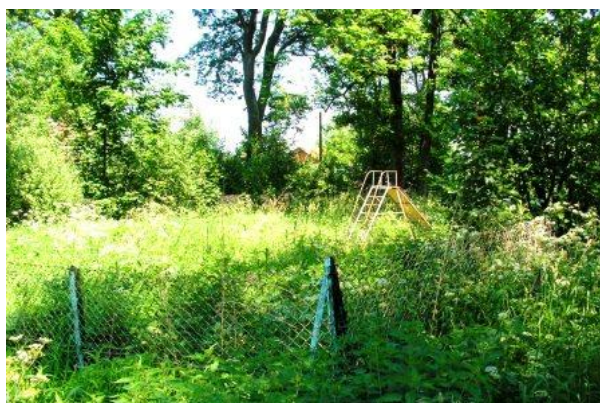
Plac zabaw w Starych Bolitach