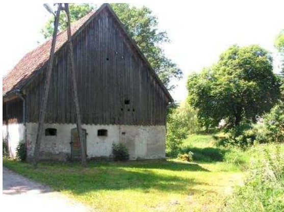
Teren wokół budynku świetlicy