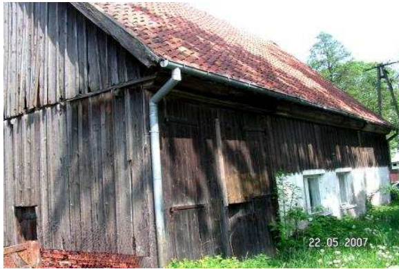
Część przeznaczona na zaplecze kuchenne