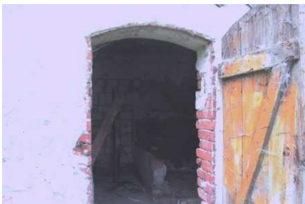
Pomieszczenie przeznaczone na sanitariaty w świetlicy i obecne sanitariaty