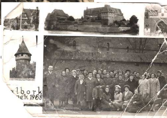
Członkinie KGW ze Starych Bolit podczas wycieczki

KGW organizowało cykliczne imprezy min. Członkinie KGW uczestniczyły w Dożynkach na Targach Poznańskich.