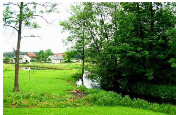
Stare Bolity, most nad rzeką Naryjska Struga i widok na rzekę

Na terenie gminy występuje kilka skupisk małych jezior oraz dwa większe jeziora: