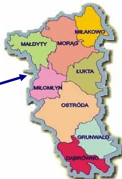
Rys. 1 Lokalizacja wsi Stare Bolity