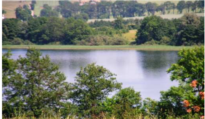
Widok z drogi do Starych Bolit na Jezioro Mildzie.

W odległości 4,5 km od Starych Bolit znajduje się, położone już na terenie gminy Morąg przepiękne Jezioro Narie .