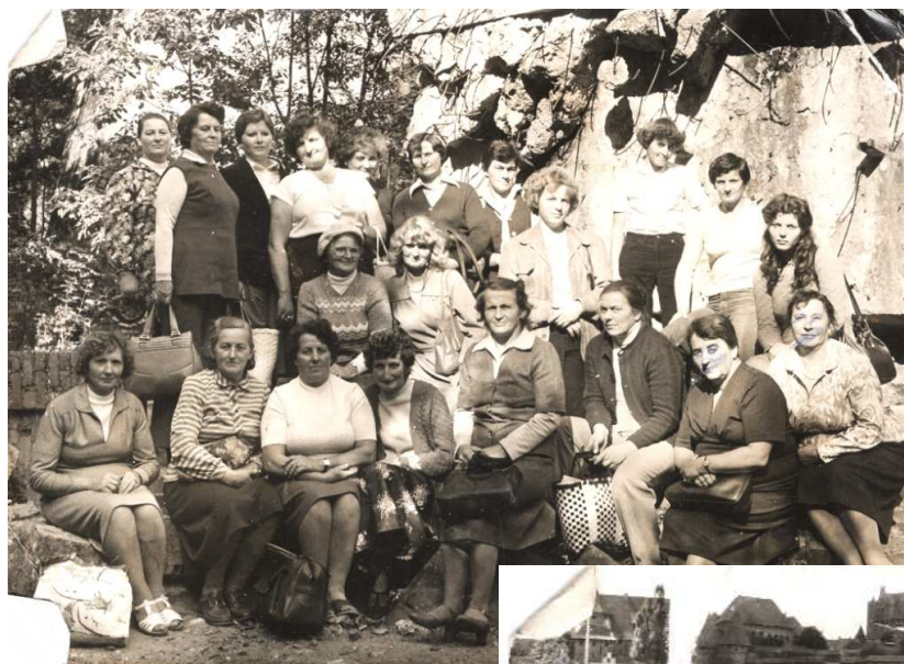
Członkinie KGW; lata 70.

Mimo swojej wielokulturowości mieszkańcy Starych Bolit wykazywali dużą aktywność. Niemal od momentu zaludnienia wsi w Starych Bolitach działało Koło Gospodyń Wiejskich.