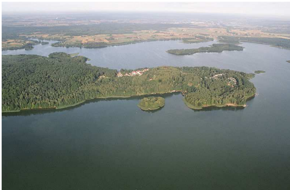
Widok na Narie z lotu ptaka

W odległości 4,5 km od Starych Bolit znajduje się, położone już na terenie gminy Morąg przepiękne Jezioro Narie .