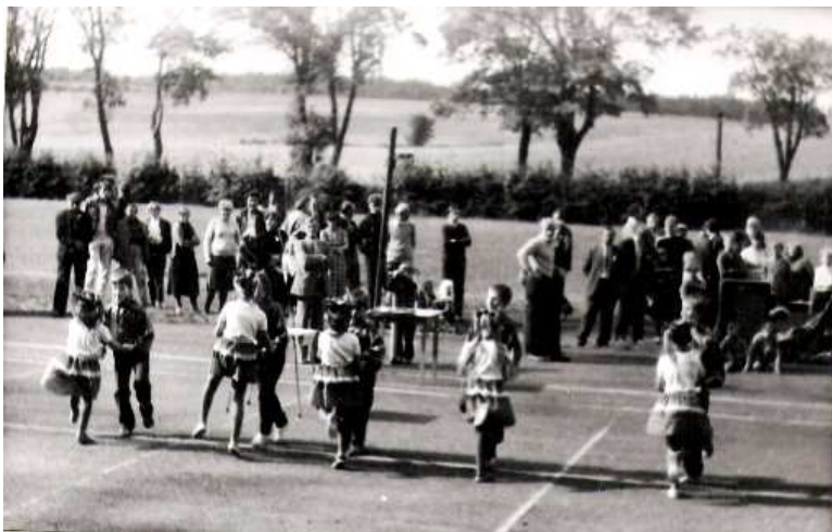
Występ zuchów ze Starych Bolit w Miłakowie; lata '70

Ta aktywność zanikła wraz z zamknięciem szkoły , która stanowiła centrum życia kulturalnego wsi. Podupadła także nie remontowana od dziesięcioleci wiejska świetlica. Mimo to w świetlicy wciąż organizowane są spotkania i uroczystości. Ostatnio Pani Sołtys na placyku koło świetlicy zorganizowała Dzień Dziecka z piknikiem i ogniskiem dla mieszkańców wsi.