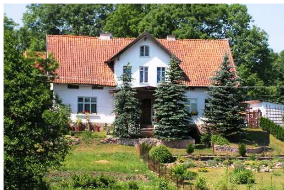
Stare Bolity. Ten sam dom na zdjęciu z 1907 r. i dziś.