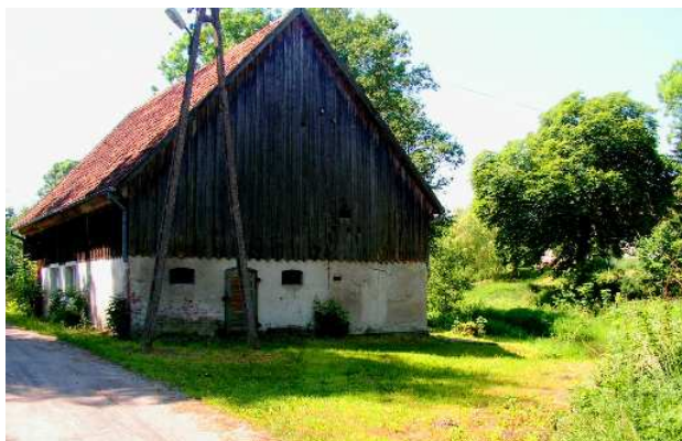
Budynek świetlicy w Starych Bolitach

Ostatnio mieszkańcy zaktywowani przez Panią Sołtys na terenie przy świetlicy zorganizowali piknik rodzinny z okazji Dnia Dziecka.