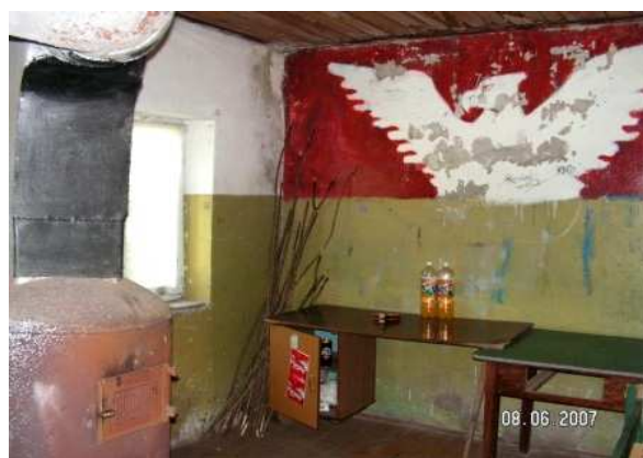
Wnętrze świetlicy magazynek i kotłownia