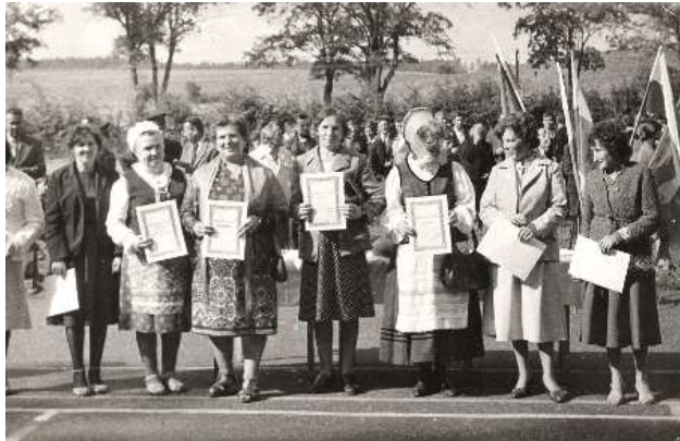
Członkinie KGW ze Starych Bolit z dyplomami za najlepsze potrawy regionalne – Dożynki Gminne w Miłakowie.