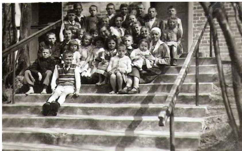
Dzieci, które rozpoczęły rok szkolny 1946/47, w środku pierwsza nauczycielka w Starych Bolitach.