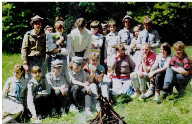
Drużyna harcerska rok 1991.

Spółeczność lokalna zintegrowana była wokół istniejącej do 2002 r. szkoły. Przez wiele lat w szkole w Starych Bolitach działał szkolny klub sportowy , klub PCK , była drużyna harcerska , działał teatrzyk szkolny .